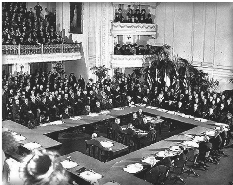
Versailles - „Békekonferencia”

RENITÁS MEGSÉRTÉSÉ-t, s ezen a címen vissza kell utasítani a Monarchia követelését. Ebben az esetben a terrorszervezet felszámolására nemcsak nem kerül sor, hanem az antant Szerbia és az országban működő terrorszervezet megvédéséért egy európai háborút is vállal! Tehát éppen az IGAZSÁG antant által történt sárba tiprása robbantotta ki az