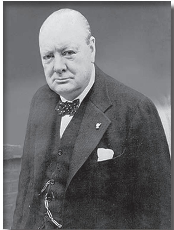
Sir Winston Leonard Spencer Churchill Az Egyesült Királyság miniszterelnöke