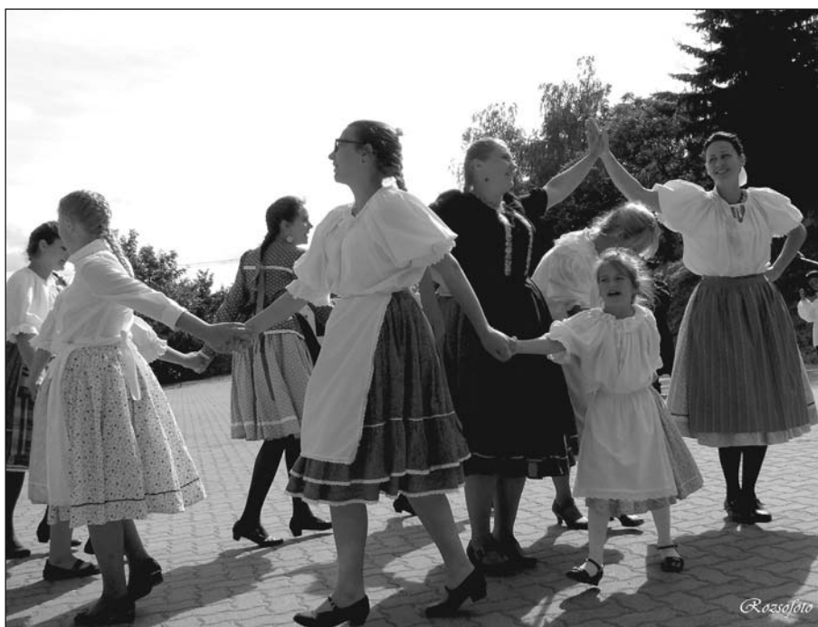
A tánccsoport megalapozta a nap jó hangulatát