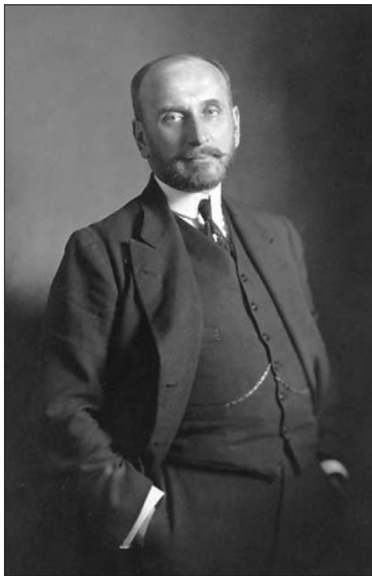
Szazonov, az Orosz Birodalom külügyminisztere

tus 6-án, Szerbia Németországnak ugyanacsak augusztus 6-án, Montenegro Németországnak augusztus 11-én, Franciaország és Anglia a Monarchiának augusztus 12-én, a Monarchia Belgiumnak augusztus 27-én.